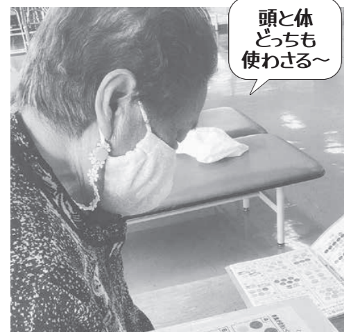
頭と体 どっちも 使わせる～

デイケアのリハビリは、訓練室だけではなく、感染対策の一環や、利用者様のご希望により、テイルーム内や周辺の廊下を使用し、行うこともあります。環境は異なりますが、状況に応じ、都度リハビリ内容を変更し行っています。