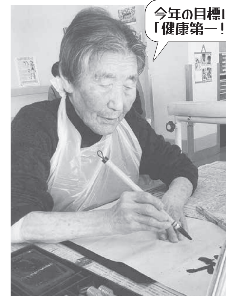
今年の目標は 「健康第一!」